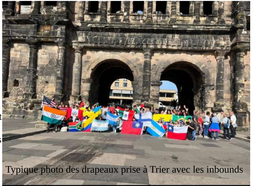
Typique photo des drapeaux prise à Trier avec les inbounds