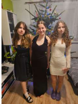
Mes host sisters dans ma première famille

Tout d'abord j'ai passé un merveilleux Noël et un super bon Nouvel An: