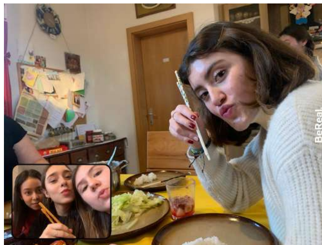
Nouvel ans chinois

Je fais aussi des activités avec mes amis, par exemple j'ai fêté le Nouvel An chinois chez une étudiante Taiwanaise et je suis allée à Vienne, qui est à seulement 30 minutes de Bratislava, pendant le marché de Noël, c'était absolument génial.