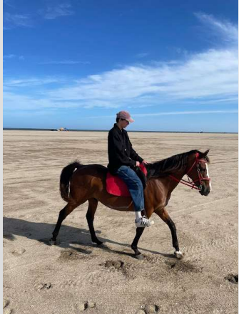
Rien de mieux qu'un mate à la plage