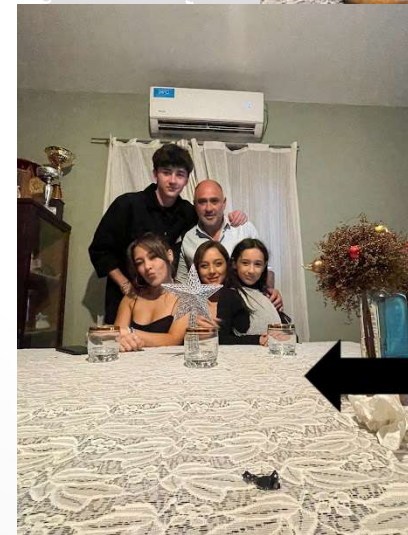
Noel avec ma famille