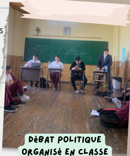
DÉBAT POLITIQUE ORGANISÉ EN CLASSE

Les matières : Durant toute la scolarité, les élèves ont des matières générales, c'est seulement à la 4e année en école secondaire que les élèves ont à choisir entre la filière économique et sociale. (dans mon cas je suis en filière économique).