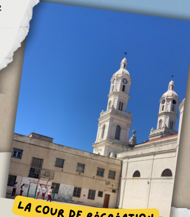
LA COUR DE RÉCRÉATION

En plus, j'ai vraiment pris mes repères à l'école, j'ai même eu mes premières évaluations et tout s'est extrêmement bien passé. Au sujet du système éducatif argentin, il se distingue réellement du système éducatif français. En effet, il y a une grande disparité sur certains aspects, tels que :