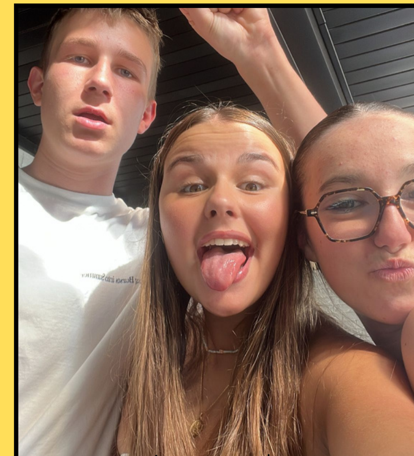
ma copine espagnole et mon copain allemand