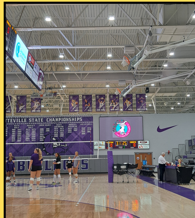
terrain de volleyball de mon lycée