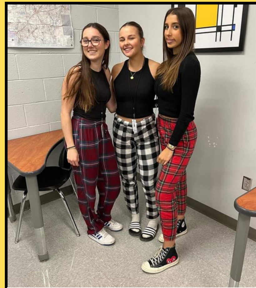
pyjama day !!

Ici les cours sont vraiment plus simples, l'école est beaucoup moins académique qu'en France et les professeurs sont très amicaux. J'ai pu choisir des cours de cuisine, j'ai rencontré de nouvelles personnes et me suis faite des amis, je suis fière de moi car je ne me suis pas donnée le choix d'aller vers les autres et c'est à mon avis la meilleure chose à faire lorsqu'on est étudiant d'échange.