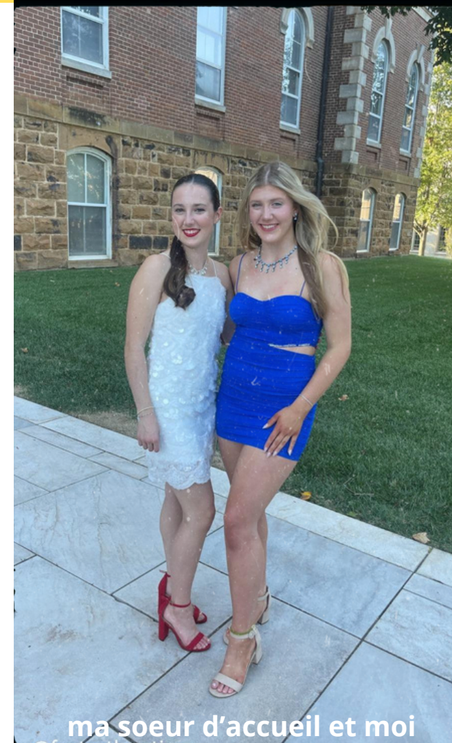
ma soeur d'accueil et moi

Nous avons fait de nombreuses activités ensemble et c'est avec eux que j'ai acheté ma robe pour Homecoming. C'est un bal qui célèbre le début de la saison du football, c'était très amusant, nous avons dansé et pris de nombreuses photos. Le lycée organise aussi une parade pour homecoming, il y a de nombreux chars représentant chacun un sport ou une activité, j'ai défilé sur le char de la swim team, que j'ai intégrée au début de l'année, nous devions nous habiller comme des surfers ou des cyclistes.