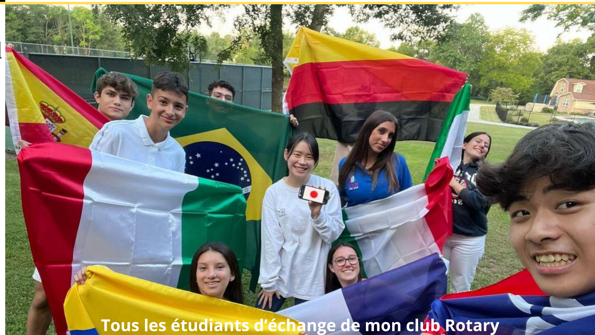
Tous les étudiants d'échange de mon club Rotary

Je souhaite à tout le monde de vivre une expérience comme celle-ci, le seul moyen de comprendre ce que ça fait d'être étudiant d'échange, c'est de le vivre. Et je suis tellement reconnaissante envers le Rotary de me le permettre.