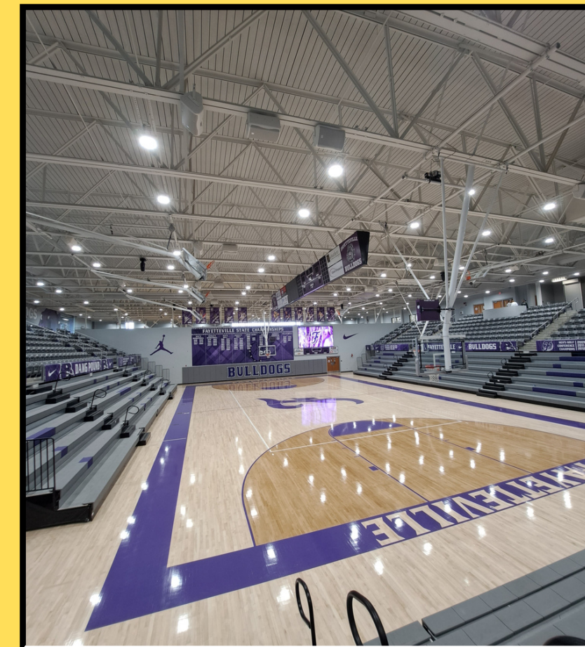
terrain de basketball de mon lycée