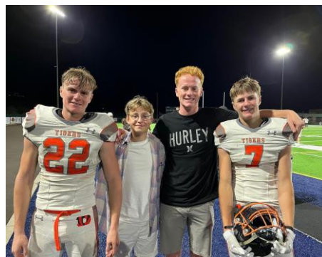
Moi et trois de mes frères