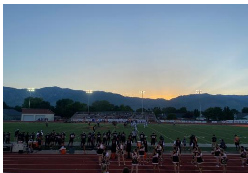
Terrain de football américain de mon lycée

J'ai aussi eu l'occasion de voir des matchs de football américain car deux de mes frères jouent pour le club du lycée.