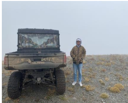
Photo de moi et du buggy dans les nuages