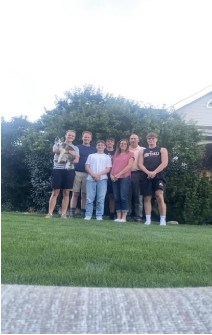
Photo de moi et ma famille d'accueil le premier soir.