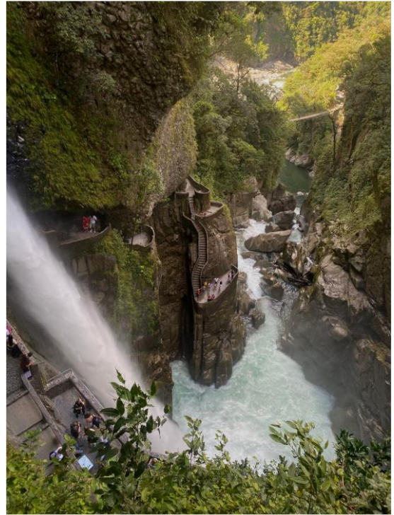
CASCADE EL Pailon del Diablo