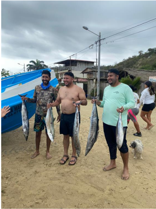
Retour de pêche 12 09 2023

Pour conclure le premier mois est passé rapidement mais lentement, c'est très spécial de changer d'environnement mais j'arrive à m'y faire petit à petit, j'ai vu et vécu des choses absolument hors du commun en si peu de temps ! Je pense que je commence à réellement aimer ce pays !!